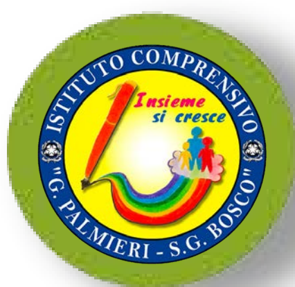
I.C. PALMIERI - BOSCO San Severo

PRESSO SALA ENTE PROVINCIA VIA P. TELEFORO 53 FOGGIA