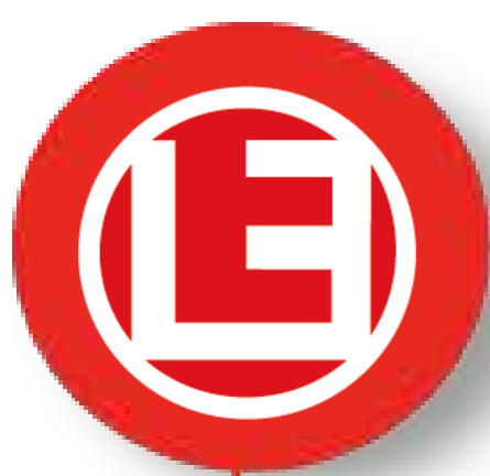
I.I.S.S. EINAUDI Foggia