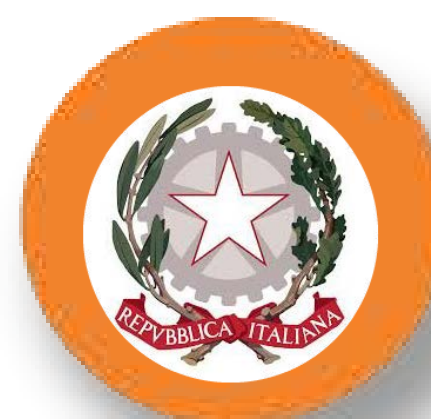
I.I.S. PAVONCELLI Cerignola